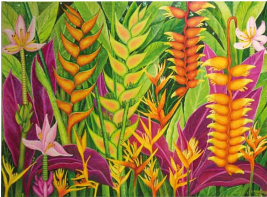
Jardim Tropical II - Óleo s/ tela - 1,20x0,90m