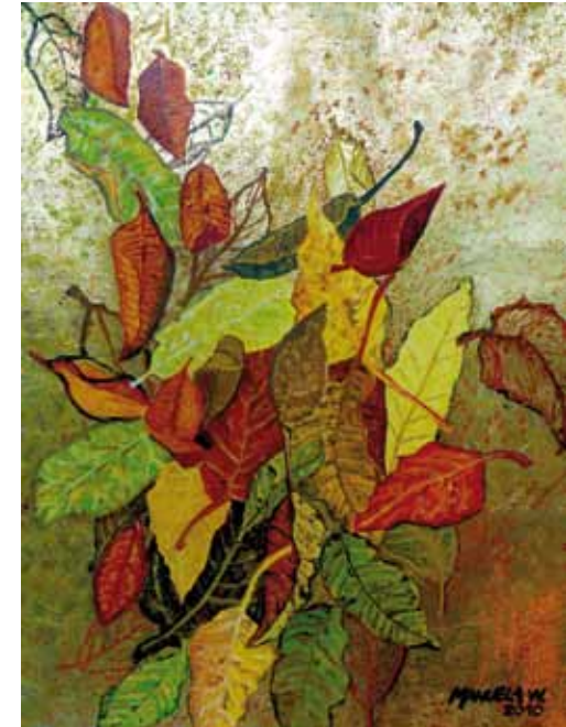
Folhas II - Acrílico e folha de ouro s/ tela - 0,40x0,50m