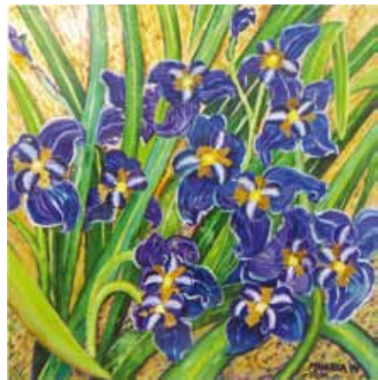
Lírios Selvagens - Óleo e folha de ouro s/ tela - 0,50x0,50m

Toda esta riqueza presente nos meus quadros, que já foi mais figurativa e autêntica, começou a derivar para a composição imaginativa, em que as cores são libertadas da tarefa de representar a realidade. A cor passou a determinar a forma e o espaço. O ritmo das cores e das formas coloca-se no mesmo nível. E agora a introdução da folha de ouro na minha pintura, é como que para aprisionar a luz, sublinhá-la, dando ao quadro uma leitura variada conforme o ângulo em que é observado. Continuo com os motivos da Natureza que me são tão caros, mas em composições livres, e, onde por vezes há o atrevimento de algum abstraccionismo.