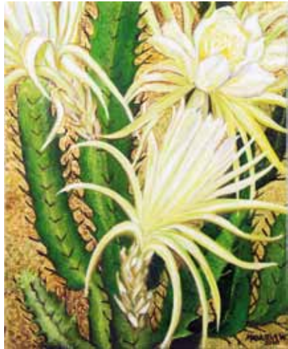
Flores Nocturnas - Óleo e folha de ouro s/ tela - 0,40x 0,50m