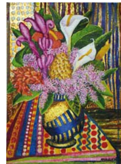
Jarra Azul Dourada c/ flores - Óleo e folha de ouro s/ tela - 0,50x0,70m