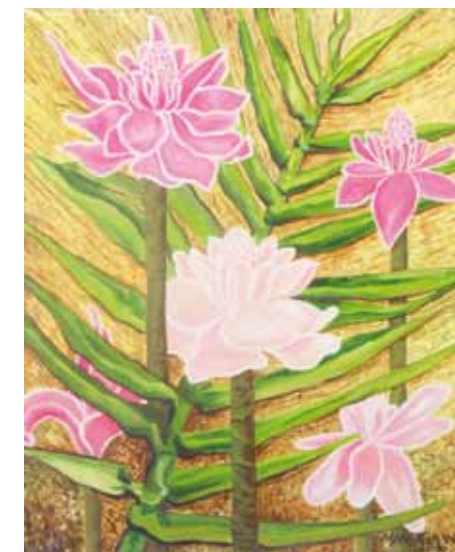
Bastão do Imperador - Óleo e folha de ouro s/ tela - 0,40x0,50m