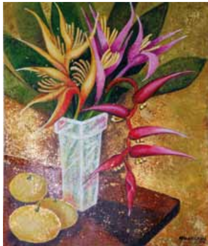
Helicónias e Araça Boi - Óleo e folha de ouro s/ tela - 0,40x0,50m