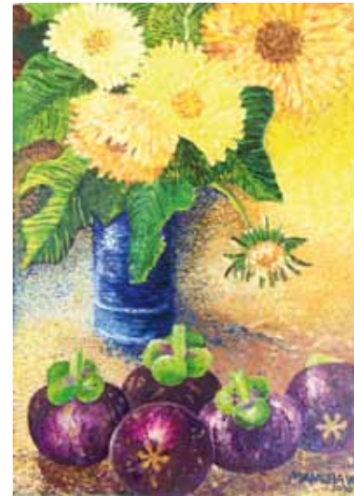
Mangosteens e Girassóis - Óleo s/ tela - 0,25x0,35m