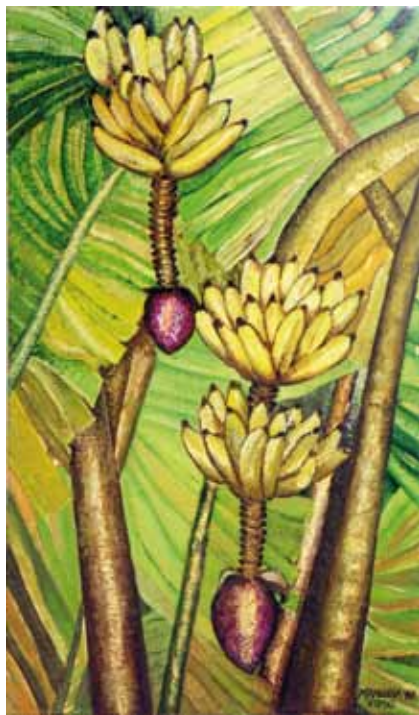
Cachos de Bananas - Óleo e folha de ouro s/ tela - 0,40x0,70m