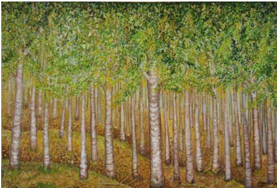
Seringueiras - Óleo e folha de ouro s/ tela - 1,17x0,80m