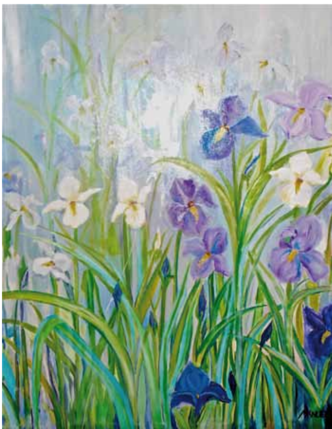
Lírios da Mata - Óleo s/ tela - 0,80x1,00m