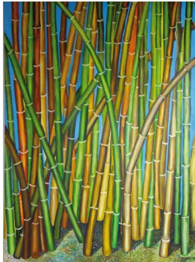
Bambus - Óleo s/ tela - 1,00x1,40m