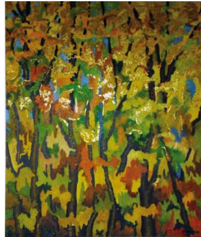
Outono Dourado - Óleo e folha de ouro s/ tela - 0,80x0,90m