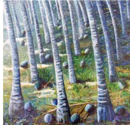
Luar nos Coqueiros - Óleo s/ tela - 0,50x0,50m