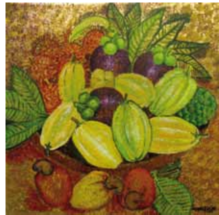
Frutas Tropicais - Acrílico e folha de ouro s/ tela - 0,30x0,30m