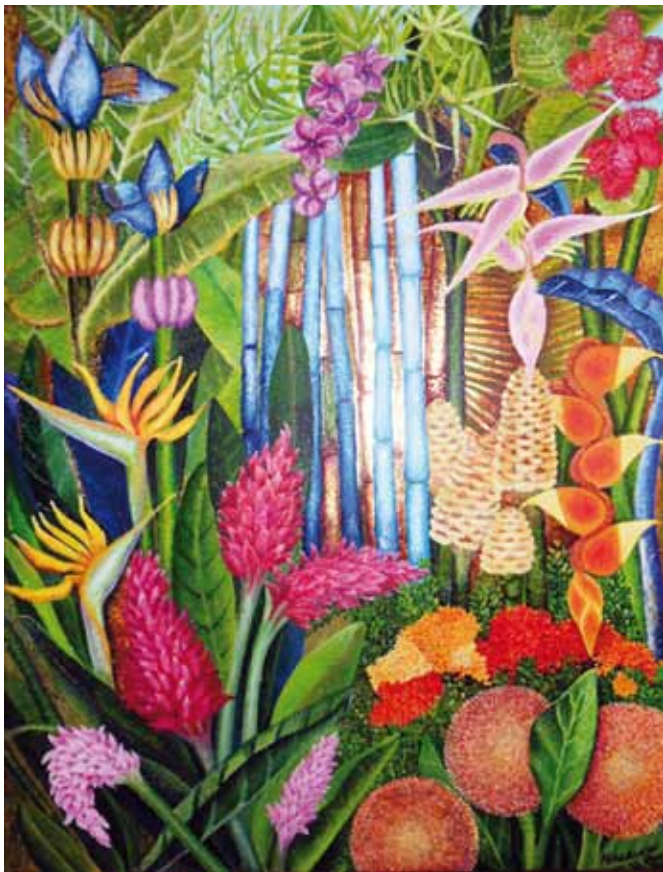
Jardim Tropical I - Óleo e folha de ouro s/ tela - 0,90x1,20m