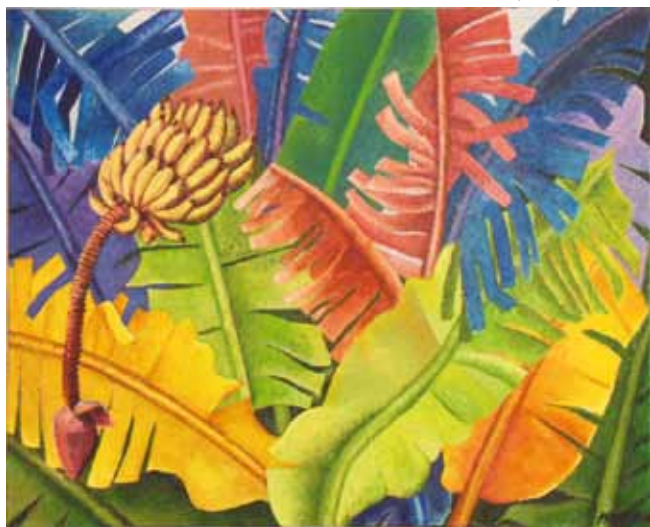
Bananeiras - Óleo s/ tela - 0,95x0,75m