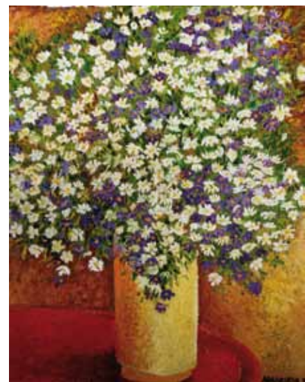
Jarra Amarela c/ flores - Óleo e folha de ouro s/ tela - 0,40x0,50m